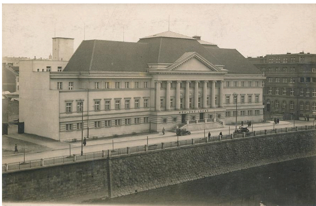
Obr. 3: Městské lázně v Plzni krátce po dokončení stavby v roce 1932 podle projektu architekta Bedřicha Bendelmayera. Budova představovala vrchol tehdejší moderní architektury a hygienických standardů. [1]

Plzeňský kraj v září 2022 zakoupil budovu městských lázní s ambicí jejich obnovy pro galerijní a kulturní funkce. Po desetiletích chátrání to byla zásadní příležitost k oživení centra a posílení kulturní infrastruktury regionu. Kraj deklaroval cílové využití jako multikulturní centrum a sídlo Západočeské galerie, s odhadem nákladů v řádu dvou miliard korun a s ambicí rychlého postupu přípravy a realizace.