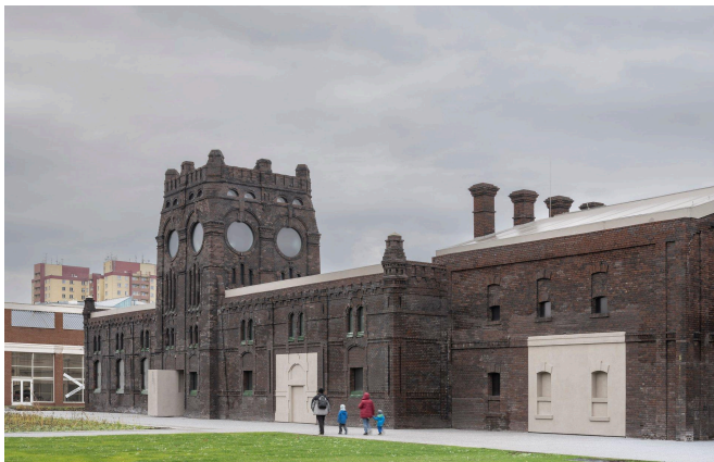
Obr. 6: Galerie PLATO v Ostravě, konverze bývalých jatek na moderní galerijní prostor. Projekt architekta Roberta Konieczného a ateliéru KWK Promes byl oceněn Českou cenou za architekturu a vznikl na základě architektonické soutěže.