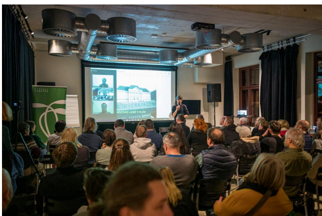
Obr. 2: Veřejná debata Quo vadis, městské lázně? v prosinci 2022 a lednu 2023, kterou zorganizoval spolek Pěstuj prostor. Debaty se zúčastnili odborníci, památkáři, zastupitelé a veřejnost. Zdroj: Pěstuj prostor [2]