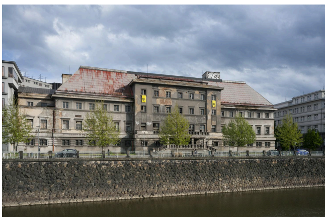
Obr. 4: Současný stav budovy městských lázní v Plzni. Po desetiletích chátrání je fasáda poškozená, chybí původní střešní krytina, přesto zůstává zachována architektonická hmota a dispozice.